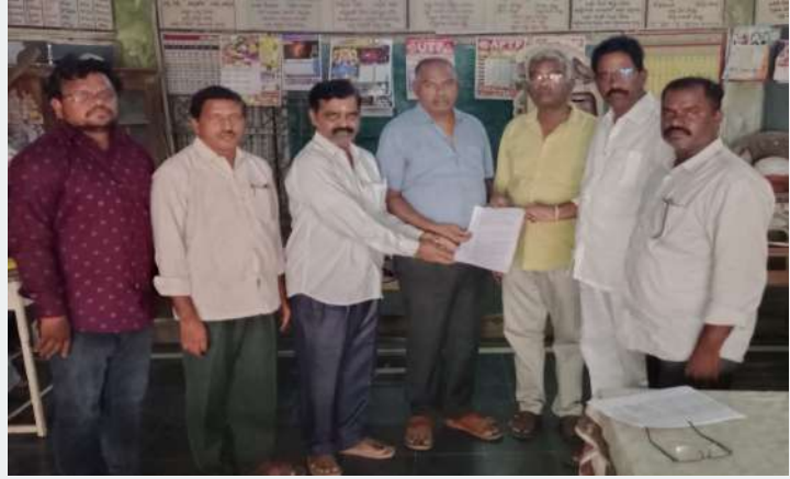
బుచ్చిరెడ్డిపాలెం స్వర్ణ సాగరం మే 23