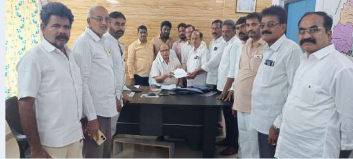
కనిగిరి స్వర్ణ సాగరం మే 23