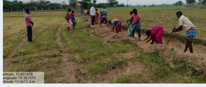
స్వర్ణ సాగరం ఏర్పేట

మహాత్మా గాంధీ జాతీయ గ్రామీణ ఉపాధి హామీ పథకం కింద ఏర్పేట మండలంలో చేపడుతున్న "జలధార - జలహారతి" పనులను డ్యామా పథకం సంచాలకులు ఎం.సి. మద్దిలేటి శనివారం తనిఖీ చేశారు. మండలంలోని 12 గ్రామపంచాయతీల పరిధిలో రూ.35,56,848 వ్యయంతో 25 వంట కాలువలు, వరస కాలువల పనులకు అనుమతులు మంజూరయ్యాయని తెలిపారు. ఇప్పటివరకు 23 పనులు ప్రారంభించి రూ.12,98,708 వ్యయం చేసినట్లు అధికారులు వెల్లడించారు. ఇందులో భాగంగా పల్లం గ్రామపంచాయతీలో కొనసాగుతున్న జలధార - జలహారతి పనులను ఎం.సి. మద్దిలేటి పరిశీలించి, పనులను వేగవంతంగా పూర్తి చేయాలని ఉపాధి హామీ సిబ్బందికి ఆదేశాలు జారీ చేశారు. ఈ కార్యక్రమంలో ఉపాధి హామీ పథకం సిబ్బంది పాల్గొన్నారు.