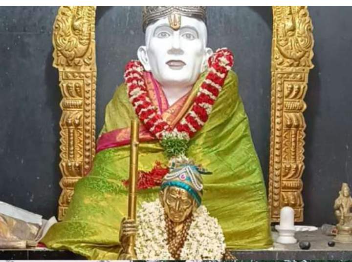
మనుబోలు : జూన్ 10