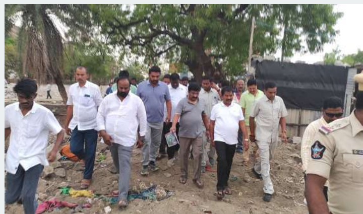
కనిగిరి స్వర్ణ సాగరం మే 23