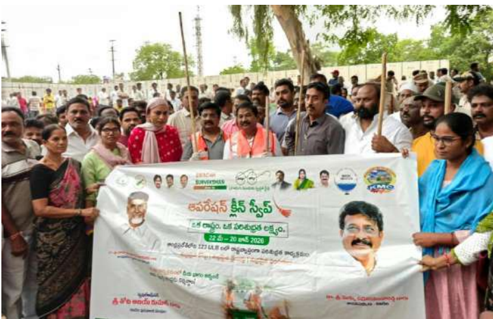
కనిగిరి స్వర్ణ సాగరం మే 23