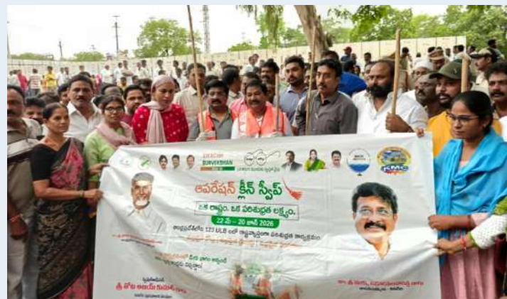
కనిగిరి స్వర్ణ సాగరం మే 23