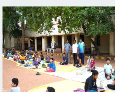
కనిగిరి స్వర్ణ సాగరం మే 23